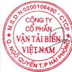
Vũ Trường Thọ